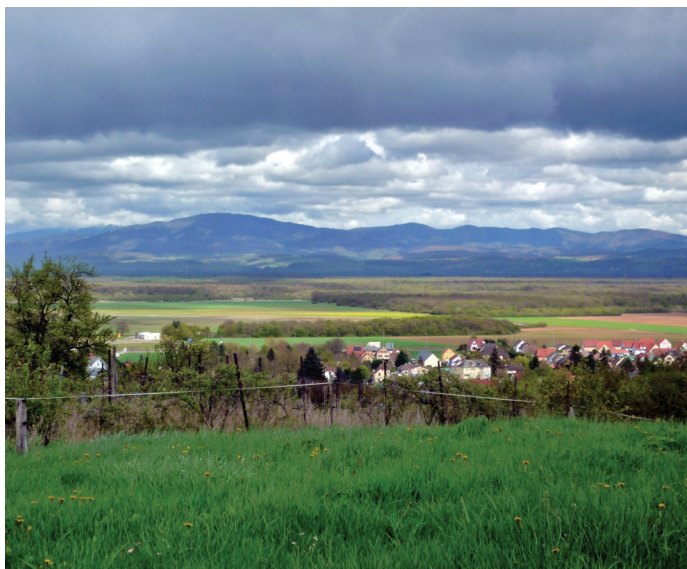
Blick von der „Belle Vue de Habsheim“ über die Rheinebene auf den Schwarzwald Vue de la « Belle Vue de Habsheim » sur la vallée du Rhin et la Forêt Noire