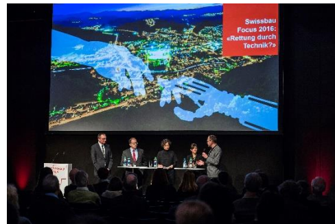
Espace de Réflexion pour la Culture du Bâti, Basel – une ville au sein de l'espace trinational | aménagement territorial pour une Suisse à 10 millions d'habitants