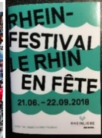
Festival le Rhin en Fête