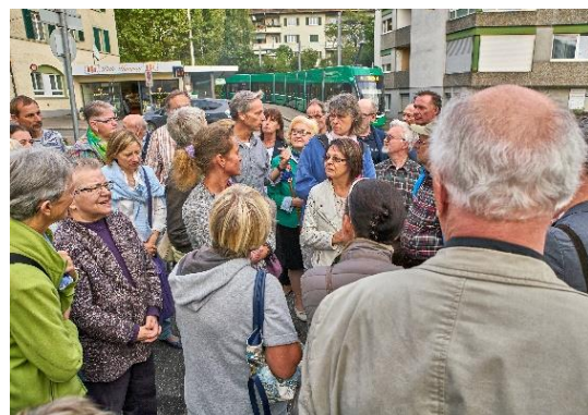
Visite guidée dans le cadre du concours d'idées 2016 pour le projet IBA « Am Zoll Lörrach / Riehen »