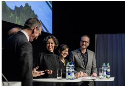
Swissbau Focus 2016