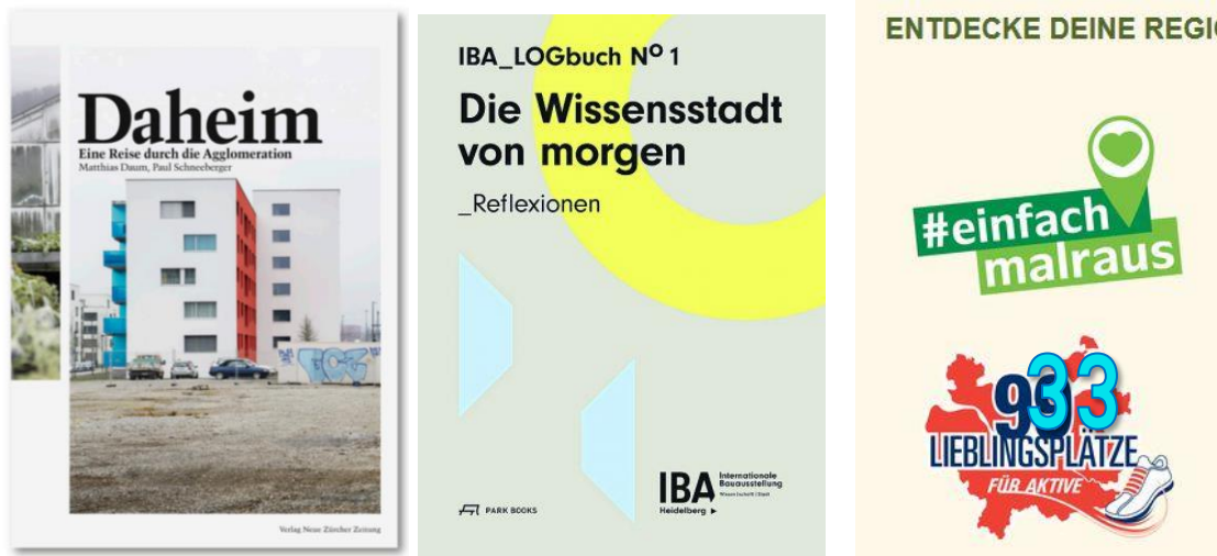
Titre : Chez-soi – un voyage dans l'agglomération Publication IBA Heidelberg

Après validation du concept d'exposition et d'évènements, le concept de publication sera élaboré de manière détaillée par le groupe de travail (GT3).