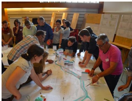
IBA Rheinliebe - Workshop 2017