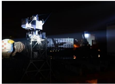
Spectacle de lumières Dreiland – présentation intermédiaire de 2013