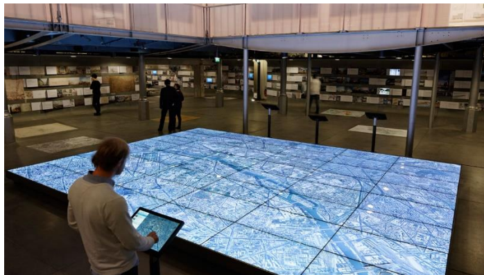
Paris multimédia, pavillon de l'arsenal, Paris