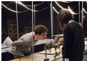
Maquettes - Archizoom EPFL Lausanne