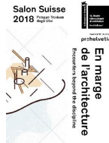
Programme Salon Suisse 2018