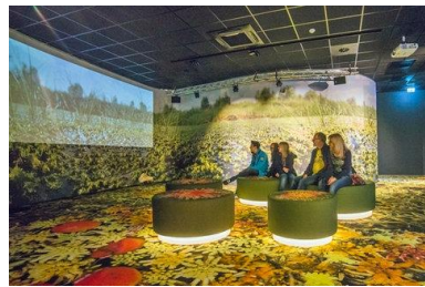
Paysage de découverte multimédia - Pipi Lotti Kunsthaus Zürich