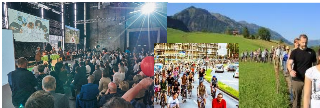
Inauguration de la présentation intermédiaire IBA 2016

L'IBA Basel doit attirer toute l'attention du public professionnel international, des politiques et des médias, par ex.