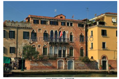
www.slamy.com - GYKHS