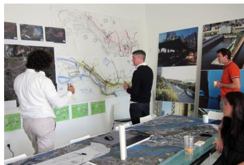
IABR Atelier Rotterdam, 2016