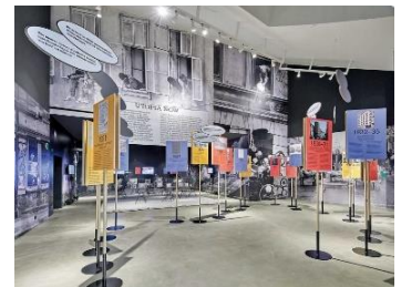
Textes - Togheter 2017, Vitra Design Museum