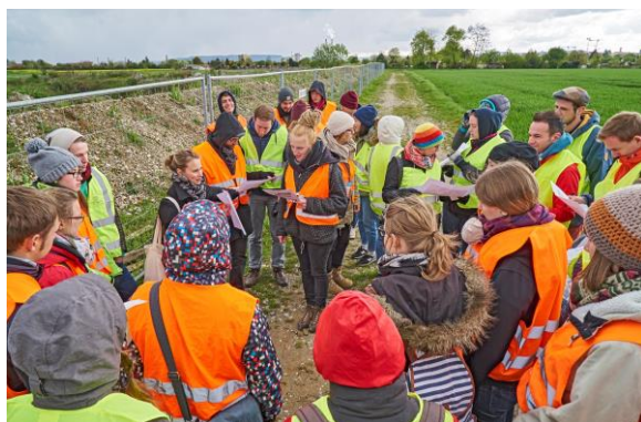
Visite « IBA Parc des Carrières » 2016